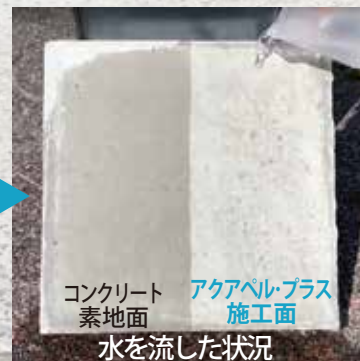
コンクリート素地面