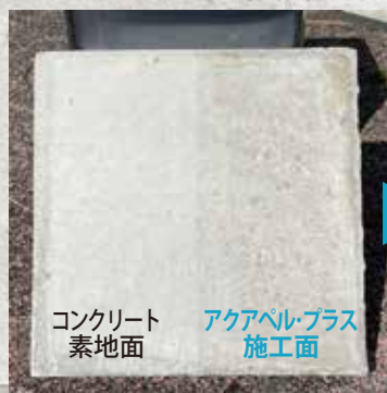
コンクリート素地面